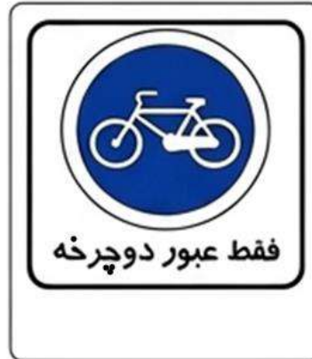
فقط عبور دوچرخه