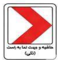
حاشیه و جهت نما به راست (تکی)