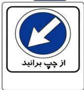
از چپ برانید