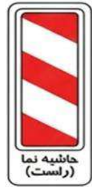
حاشیه نما (راست)