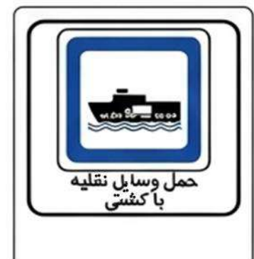
حمل وسایل نقلیه با کشتی