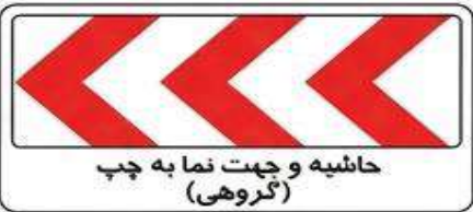
حاشیه و جهت نما به چپ (گروهی)