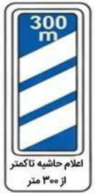
اعلام حاشیه تا کمتر از ۳۰۰ متر