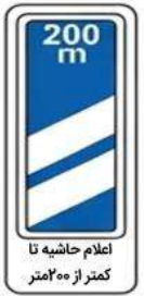
اعلام حاشیه تا کمتر از ۲۰۰ متر