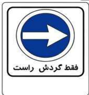
فقط گردش راست