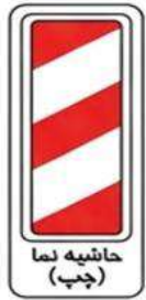
حاشیه نما (چپ)