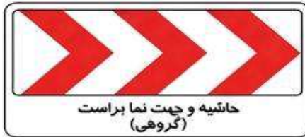
حاشیه و جهت نما بر راست (گروهی)