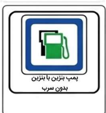
پمپ بنزین با بنزین بدون سرب