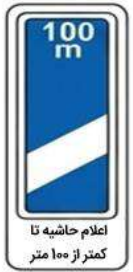
اعلام حاشیه تا کمتر از ۱۰۰ متر