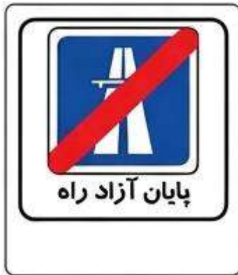
پایان آزاد راه