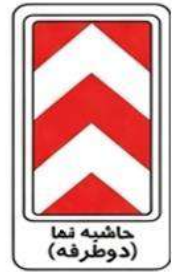
حاشیه نما (دوطرفه)