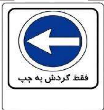
فقط گردش به چپ