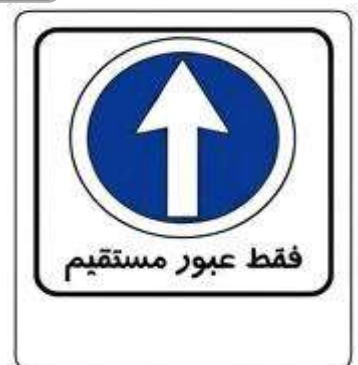
فقط عبور مستقیم