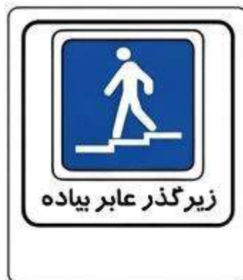
زیر گذر عابر پیاده